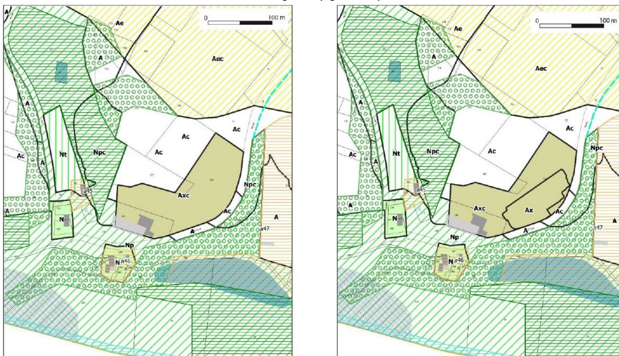
Figure n°2 : Extrait du plan de zonage

Ainsi, la révision allégée n°2 du PLUi du Créonnais consiste à reclasser en secteur Ax 0,45 hectare des 1,69 hectare classés en secteur Axc dans le PLUi en vigueur (figure n°2).