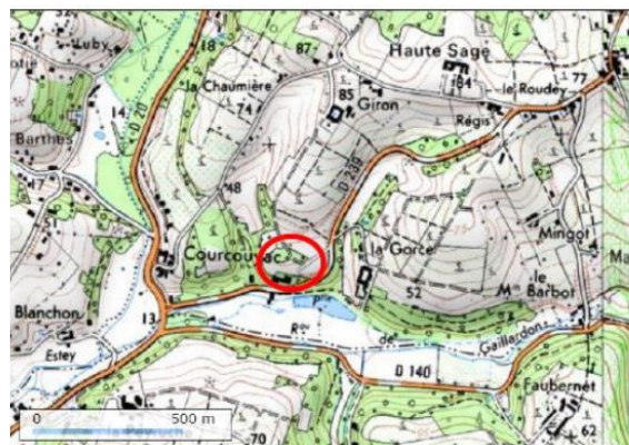
Figure n°1 : Localisation de la commune et du secteur concerné par la révision allégée n°2 (rapport de présentation page 9)

La révision allégée n°2 du PLUi du Créonnais est soumise à évaluation environnementale en raison de la présence sur le territoire de l'intercommunalité de deux sites Natura 2000, au titre de la directive « Habitats » : la zone spéciale de conservation (ZSC) Réseau hydrographique du Gestas (FR7200803) et la ZSC Réseau hydrographique de la Pimpinne (FR7200804).