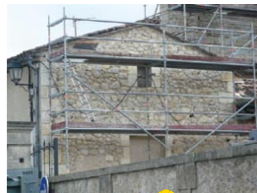
Rénovation habitat sur Croignon

L'OPAH est une des priorités pour les élus du Créonnais. Un constat a été dressé, maintenant à nous d'agir en collaboration avec les services de l'Agence Nationale de l'Habitat, la région et le département !