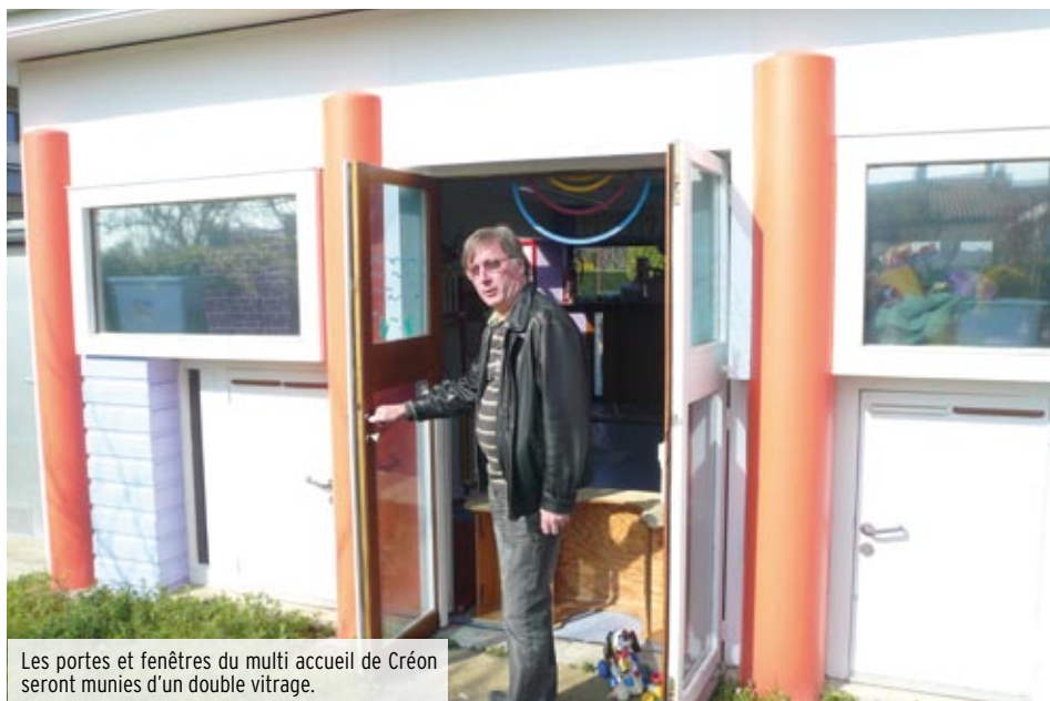
Les portes et fenêtres du multi accueil de Créon seront munies d'un double vitrage.