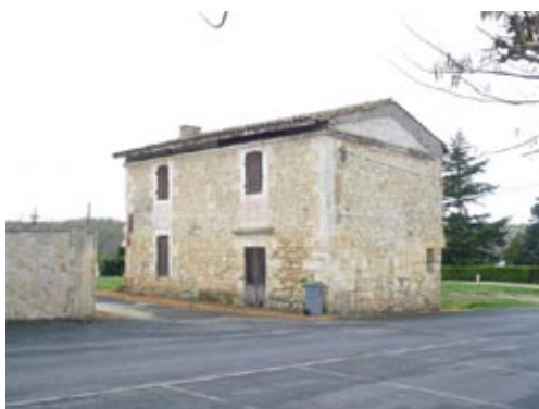
Habitat ancien sur Croignon

Il manque en gros sur notre territoire dans le parc ancien, 24 logements pour personnes vivants en grande difficulté, 100 logements à loyer modéré conformes, 100 logements à loyer conventionné corrects.