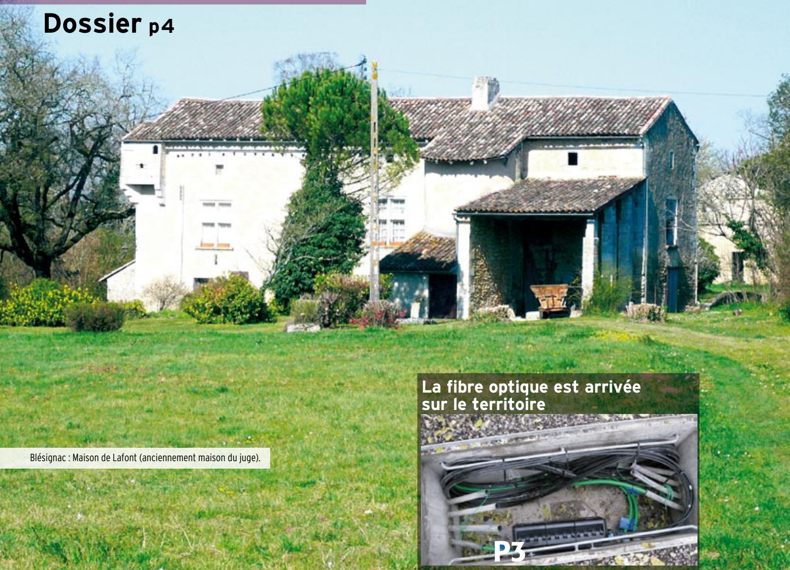
Blésignac : Maison de Lafont (anciennement maison du juge).

La fibre optique est arrivée sur le territoire