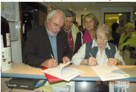
Octobre 2009 : signature convention logement d'urgence hôtel Akena de Créon