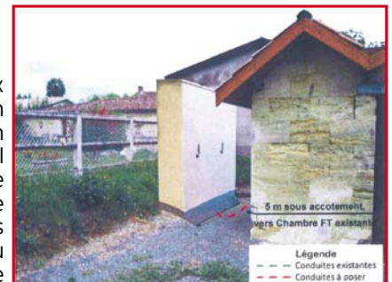
Implantation en centre bourg d'une armoire électrique ADSL Bi-dslam

La première sur le territoire, la mairie de Haux vient de recevoir une demande d'autorisation de Gironde haut débit pour la réalisation d'un ouvrage. Entre le 15 février et le 15 avril 2010, route du Grand Chemin sur la placette en face de la mairie, une armoire électrique ADSL Bi-dslam, deux coffrets EDF et quelques câbles seront installés pour le passage du haut débit vers les habitants de la commune jusque-là bien mal desservis. Viendra ensuite le plan de déploiement, la commune de Loupes qui accèdera au haut débit depuis Fargues St-Hilaire via Bonnetan.